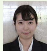
九州建設株式会社 (九州産業大学卒)