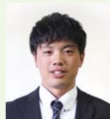
株式会社大蔵組 建築部 福岡支店土木課 (福岡建設専門学校卒)