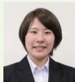
株式会社サンコービルド (熊本工業高等学校卒)