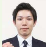
半田建設株式会社 工事部 (近畿大学卒)